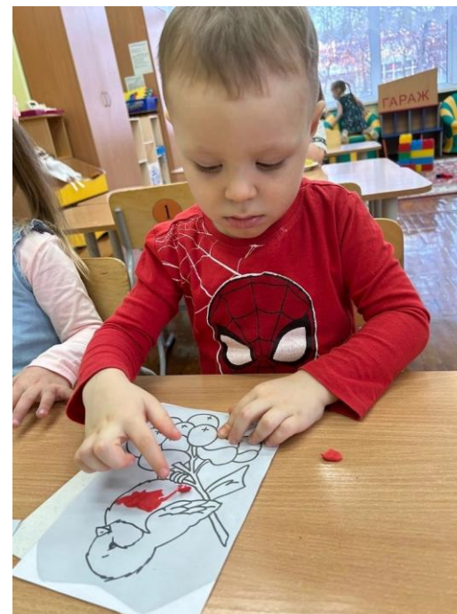
Пластилинография «Снегирь на ветке»